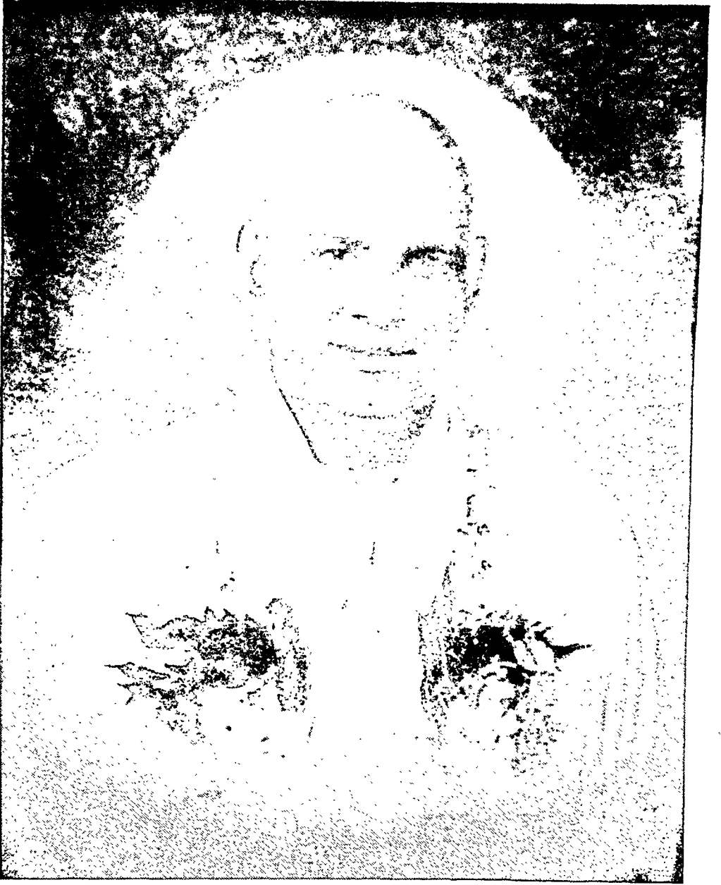
स्वामी शिवानंद जी